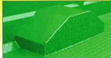
Passages des roues chanfreinés

PAS BESOIN DE PONT : les bêtes montent et descendent directement