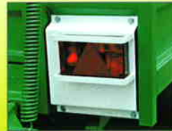
Feux arrière protégés

↳ Pont arrière rétractable en tôle larmée