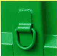
4 attaches intérieures