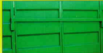
Barre anti recul (vue de l'intérieur)

↳ Tôle latérale avec 3 nerf horizontales