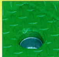
2 bouchons de vidange